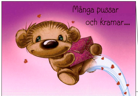
...från mig! 78-121 (ersätter 78-108)