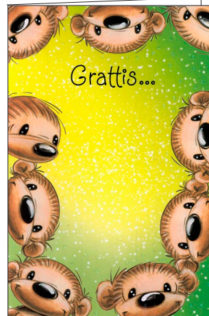
från gänget! 78-216 (ersätter 78-212)